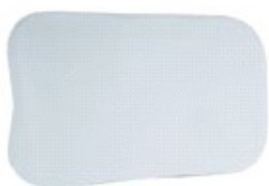
AE700-050 - Occlusale Piccolo