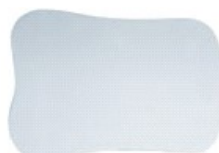
AE700-051 - Occlusale Adulti